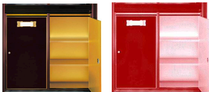
『ピアノブラック・レッド』納骨堂使用例